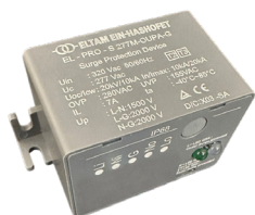
מגן נחשולי מתח משולב מגן ברקים

EITAN PRO הוא גוף תאורת רחובות מתקדם, תוצרת עין השופט מפעלי תאורה, בעל נצילות אורית גבוהה במיוחד. זמן בגדלים שונים. בעל פיזור חום מצוין ועמידות ברוחות. כולל גישה ללא כלים לתחזוקה, עמידות מכנית מצויינת ואלומות אור מגוונות, תוך שמירה על עקרונות הפחתת זיהום אור.