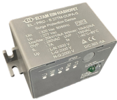
מגן נחשולי מתח משולב מגן ברקים

EITAN PRO הוא גוף תאורת רחובות מתקדם, תוצרת עין השופט מפעלי תאורה, בעל נצילות אורית גבוהה במיוחד. זמין בגדלים שונים. בעל פיזור חום מצוין ועמידות ברוחות. כולל גישה ללא כלים לתחזוקה, עמידות מכנית מצויינת ואלומות אור מגוונות, תוך שמירה על עקרונות הפחתת זיהום אור.